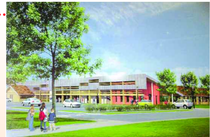
Projet du futur groupe scolaire de Dommary Baroncourt.

Comme prévu, le programme d'investissements établi par les élus de la CODECOM se met en place et vient conforter la vocation d'accueil de notre territoire.