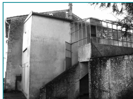
La maison située rue Maxime Gouraincourt avant réhabilitation

Les travaux relatifs à la réhabilitation de deux logements à Gouraincourt viennent de débuter. Ces deux réhabilitations situées rue Maxime Gouraincourt auront des superficies de 78 et de 93 mètres carrés. Après analyse de la Commission d'Ouverture des Plis, l'entreprise DU CHAIRE a été choisie pour le gros œuvre, PELLIN pour la charpente, la couverture et la zinguerie, A.P.B. pour la menuiserie extérieure, TABACCHI pour la plâtrerie et l'isolation, LAMBOTTIN pour l'électricité, HIRSCHAUER-EGIL pour le chauffage, la plomberie, la ventilation et les sanitaires, GIL pour la faïencerie et le carrelage, TONNES pour la peinture et EUROVIA pour la voirie et aménagements extérieurs. Le lot 4 relatif aux menuiseries intérieures a été déclaré infructueux et remis en procédure. Des demandes de subventions ont été effectuées auprès du G.I.P. (Groupement d'Intérêt Public) Objectif Meuse et du Conseil Régional de Lorraine. Les travaux orchestrés par l'architecte PIERRON seront achevés courant 2009.