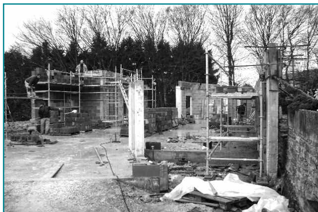
Début de construction de la crèche intercommunale d'Arrancy

Les travaux relatifs aux crèches multi-accueils viennent de débuter ; pour la structure d'Arrancy-sur-Crusnes, les entre-