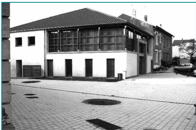
Réfection de la Place Bertrand

Les travaux relatifs à la Place BERTRAND sont achevés ; les entreprises SARIBAT pour le kiosque (maçonnerie, charpente et couverture), EUROVIA pour le pavement (Voirie et réseaux divers, espaces verts et mobilier) et SOBECA pour l'électricité (enfouissement des réseaux et éclairage public) viennent de terminer l'aménagement de la Place, sous la conduite du cabinet AUDEMA. Le projet a été financé par le Conseil Général de la Meuse, le Conseil Régional de Lorraine, l'Union Européenne et la F.U.C.L.E.M. (Fédération Unifiée des Collectivités Locales pour l'Électrification en Meuse). Un projet communal de réfection des abords de l'église fait suite à l'aménagement de la place pour un embellissement global du centre-bourg.