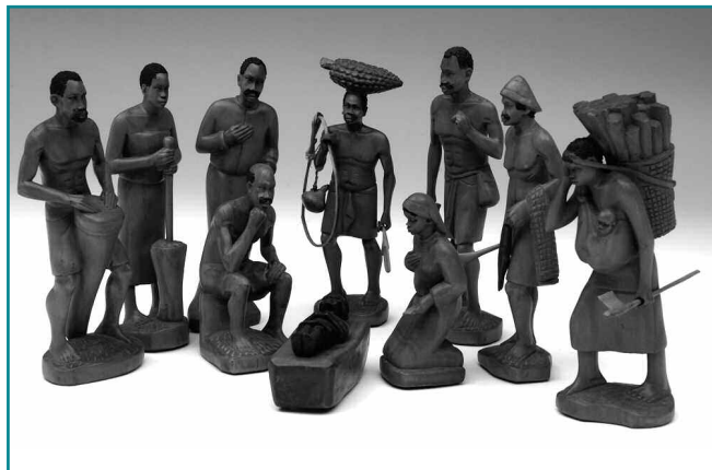
Crèche africaine de la R.D.C. (République Démocratique du Congo) en bois rouge appelé Mukula

Le village des crèches de Muzeray, haut lieu de la nativité devenu désormais incontournable, a accueilli entre le 13 et le 28 décembre 2008 plusieurs milliers de visiteurs venus découvrir plus de 500 crèches et les nombreuses animations effectuées autour du thème « crèches et nativités africaines ».