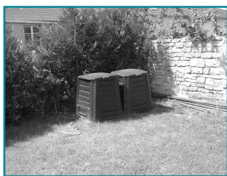
Composteurs plastiques de 340 l.

Pour une meilleure organisation, merci de nous contacter avant le 30 Avril 2009.