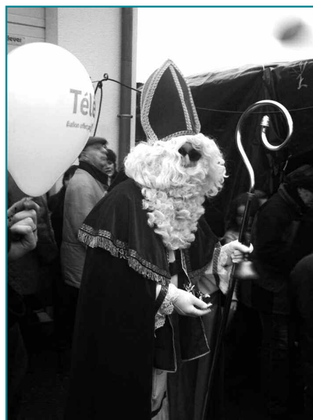
La présence de Saint-Nicolas au TELETHON (E. KIRCHER)

L'implication du secteur a été forte, notamment le Samedi 6 Décembre à Spincourt où la musique de CRESCENDO, les activités « aériennes » originales de l'association ANIM'EN CIEL, la vente de vin chaud, de macarons et de gaufres faits maison, les tours de véhicules, la vente du Marché de Noël, la vente de boules, le jeu du prénom, le jeu de dés, le jeu du colis surprise, le puzzle... ont rencontré un grand succès et ont permis de collecter plus de 7 550 €, permettant ainsi au canton de