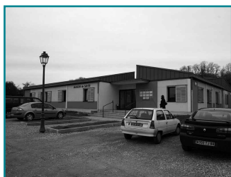
Maison de Santé à Vicherey

Le projet de maison médicale prend actuellement forme avec la participation de bon nombre de praticiens du secteur : infirmières, kinésithérapeutes, médecins, orthophoniste et pharmaciens sont convaincus par la nécessité de mettre en place une maison médicale. La Maison de Santé