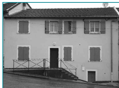
Réhabilitation de deux logements intercommunaux à Arrancy-sur-Crusnes

Deux logements intercommunaux viennent d'être réhabilités à Arrancy. Les entreprises qui sont intervenues sont SARIBAT pour la démolition, la maçonnerie, la voirie et réseaux divers, PALAZZO pour la charpente, la couverture et la zinguerie, BAUDIER pour les menuiseries, la serrurerie, les doublages, les cloisons et les faux-plafonds, LAQUESTE et ALESSI pour la plomberie et les sanitaires, LAMBOTTIN pour l'électricité, le chauffage et la ventilation, GIL pour la faïencerie et les revêtements durs, PETITJEAN pour la peinture et les revêtements de sols. Les deux nouveaux logements sont situés 3, Rue de Vermont à Arrancy. Le premier logement de type T3 d'une superficie de 82 mètres carrés est accessible aux handicapés; le second logement de type T3 situé à l'étage est doté d'une superficie de 85 mètres carrés.