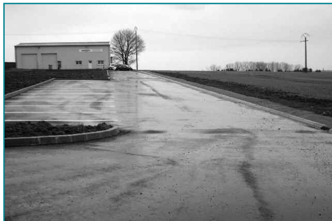
Création d'une desserte pour entreprises.

Le projet de desserte à destination d'entreprises a notamment consisté à créer une portion de voirie reliant la Route de l'Europe à l'entreprise EGIL-HIRSCHAUER, à proximité du cime-