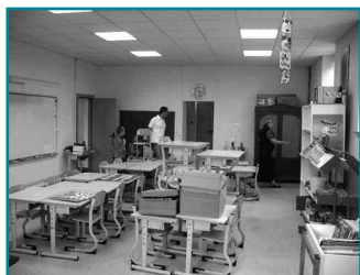
Réhabilitation d'une classe à Mangiennes

Les deux agents techniques de la Communauté de Communes, ont depuis les vacances de Juin 2008 réalisé de très nombreux travaux en particulier dans toutes les écoles du territoire. Depuis le mois de Juin, ils se sont notamment afférés avec efficacité à la réfection de plafonds à l'école de Spincourt, aux réfections du portail et de la toiture de l'école d'Eton, aux réfections de la cuisine et d'une fenêtre à l'école de Billy-sous-Mangiennes, aux remplacements de chasses d'eau, de carreaux, aux peintures, à la pose de patères, de néons, à la fabrication de marches d'escalier, aux déménagements... bref, un véritable travail de pros. Depuis décembre 2008, un troisième emploi sous dispositif C.A.E. a pu être créé afin de poursuivre sur cette dynamique.