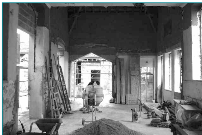
Réhabilitation de l'ancienne école communale de Spincourt en crèche

Pour la crèche de Spincourt, les entreprises retenues sont LES ATELIERS DU CHAIRE pour les démolitions et le gros œuvre, LEVERN pour la charpente, la couverture et la zinguerie, SAM pour la menuiserie extérieure, EIMA pour la menuiserie intérieure, POZZI pour l'isolation, la plâtrerie et les faux-plafonds, L.C. REALISATIONS pour la faïencerie et le carrelage, TONNES pour la peinture, HIRSCHAUER-EGIL pour la plomberie, sanitaire, chauffage et ventilation, et LAMBOTTIN pour l'électricité. (montant des travaux : 412 795,88 € H.T.). Les deux crèches sont aidées financièrement par l'Union européenne, la C.A.F., le Conseil Régional de Lorraine et le Conseil Général de la Meuse.