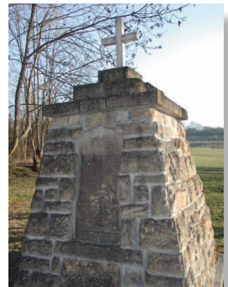
Le Monument aux Morts d'Ollières

Ce monument commémoratif est une initiative des troupes allemandes qui pendant les combats d'août 1914 érigent une stèle faite de moellons en souvenir des héros français et allemands tombés pour leur patrie ; le monument a été déplacé d'environ 200 mètres.