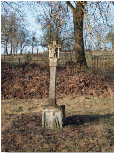
La pierre aux quatre dieux

Pierre datée du III e siècle, la pierre aux quatre dieux est un socle d'un ensemble gallo-romain appelé « les colonnes du cavalier au géant », qui comporte un socle quadrangulaire, une colonne de base octogonale surmontée d'une sculpture ; quatre divinités, Vulcain, Mercure, Hercule et un dieu local y sont représentés.