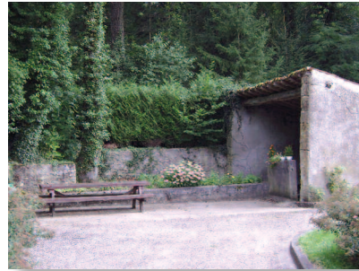
Le lavoir d'Ollières

Le petit lavoir d'Ollières, du XIX e siècle, capte la source ferrugineuse du ruisseau de Meaupré (ou Manpré) qui se jette dans l'Othain. C'est un endroit