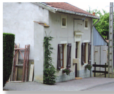
L'ancienne école d'Ollières

En 1973, une association de communes regroupe Haucourt-la-Rigole, Houdelaucourt-sur-Othain, Ollières, Réchicourt et