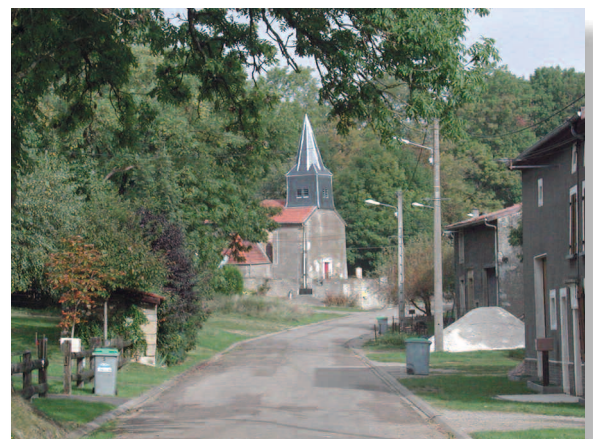
« Ollières, la rue principale du village »

Grâce à la proximité du Luxembourg et de son bassin d'emplois, nous avons pu depuis plusieurs années accueillir de nouveaux habitants. Face aux difficultés qui s'accroissent, je pense plus particulièrement à la hausse continue et dramatique pour beaucoup d'entre nous des prix du pétrole, je souhaite que nous puissions cependant rester une terre d'accueil. Pour cela, nous devons valoriser nos atouts, innover et trouver des solutions pour faire en sorte que nos villages se développent encore plus. L'intercommunalité reste l'outil essentiel pour mener à bien ce combat.