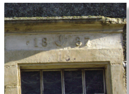
Linteau de 1837