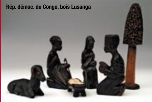
Rép. démoc. du Congo, bois Lusanga

Par contre, à Madagascar, les personnages aux lignes sobres et élégantes sont sculptés dans un bois rose foncé appelé improprement "bois de rose", alors qu'il s'agit certainement d'une variété d'acajou.