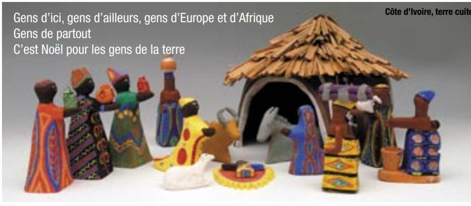
Côte d'Ivoire, terre cuite

Gens d'ici, gens d'ailleurs, gens d'Europe et d'Afrique Gens de partout C'est Noël pour les gens de la terre