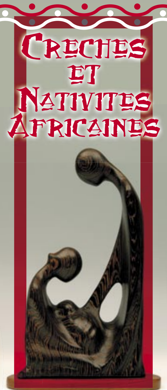
Monobloc, bois exotique, R.D.C. Kinshasa