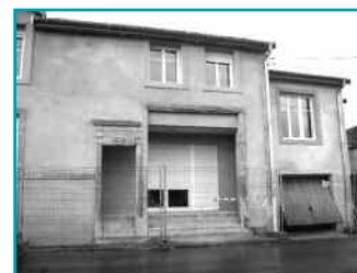
Les logements de Gouraincourt après réhabilitation

Le coût total des travaux se monte à 255 773€. La location est prévue pour début 2010.