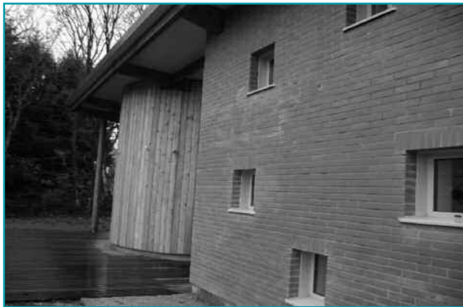
La crèche d'Arrancy-sur-Crusnes

Cà y est, nous sommes prêts. Les crèches intercommunales de Spincourt et d'Arrancy-sur-Crusnes (Pomme de Requette et Pomme d'Api) ouvriront leurs portes et accueilleront les enfants à compter du 4 janvier 2010. La construction de ces deux crèches aura été une longue mais belle aventure.