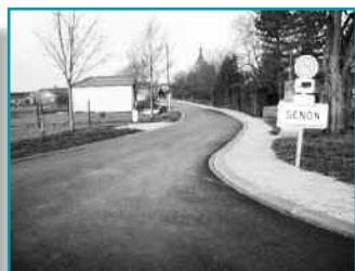
Senon : Route d'Eton.