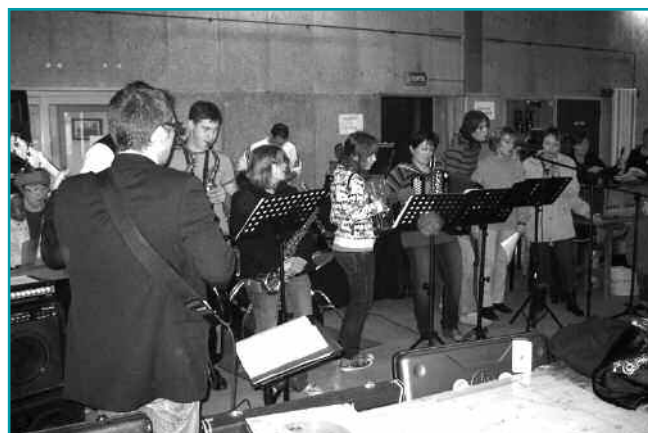
L'orchestre All Sbiecou

Le Téléthon 2009 a profité d'une mobilisation sans faille des forces vives du canton de Spincourt (bénévoles, associations, entreprises, collectivités locales...).