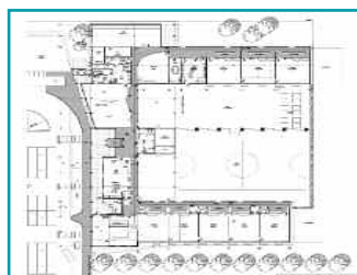
Plan architectural du futur groupe scolaire

Le groupe scolaire comptera 8 classes (3 en maternelle et 5 en primaire). Il sera équipé d'une restauration scolaire, d'une salle d'évolution, d'une bibliothèque et d'une salle informatique.