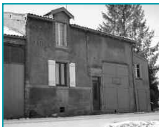
Les logements de Gouraincourt avant réhabilitation