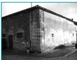
Pilier subsistant des anciennes écuries de l'abbaye

Les secteurs paroissiaux de Boulogny et de Spincourt ont été unifiés et ont donné naissance à une nouvelle paroisse fin septembre 2009. Il s'agit de la paroisse St-Bernard de la vallée de l'Othain, regroupant toutes les communes du canton, sauf Amel-sur-l'étang et Senon.