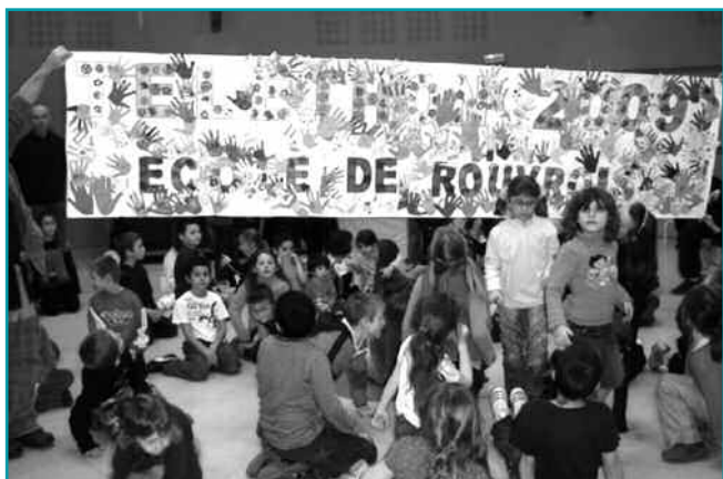
La banderole réalisée par les élèves du RPI de Rouvrois

Pour 2009, ce seront 10 000 € récoltés sur le canton qui participeront au financement des actions de l'AFM.