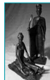
Une crèche du Burkina-Faso en bronze.

Prix de la visite : 4,00€ par adulte, 2,00€ par enfant et 3,00€ par personne pour les groupes à partir de 15 personnes.