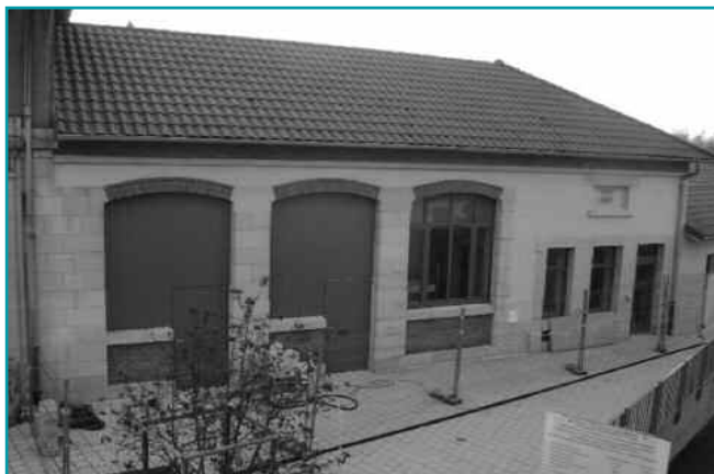
La crèche de Spincourt

Après presque deux ans d'études et d'enquêtes, auxquelles ont participé des parents, des responsables associatifs,