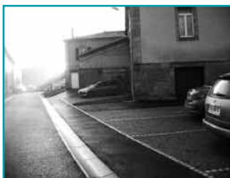
Mangiennes : Rue de la Mairie.

Ces travaux ont été conduits en partenariat avec la commune de Senon, dans le cadre d'une convention de mandat.