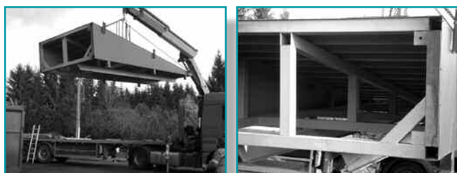
Le changement des rampes d'accès à la déchetterie de Spincourt.