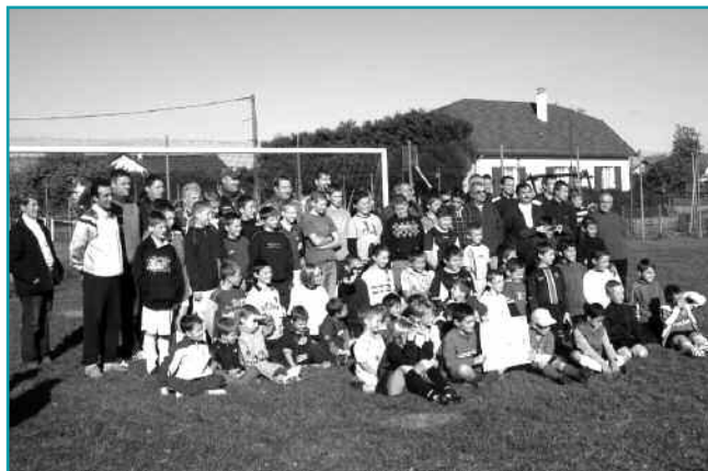
Inauguration de l'école de football de Saint-Laurent/Mangiennes

Les entraînements ont lieu sur le terrain de Saint-Laurent pour les catégories U9, U11 les mercredis de 15h à 16h30 et de 16h30 à 18h pour les catégories