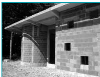
Vue de la façade de la crèche d'Arrancy en travaux

Ces deux réalisations seront opérationnelles fin 2009 et pourront accueillir chacune 10 enfants à l'ouverture prévue le 4 janvier 2010.