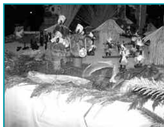
Crèche de République Démocratique du Congo en ébène

En cette année 2009 Muzeray, village de la crèche a eu pour thème « CRÈCHES ET NATIVITÉS D'AFRIQUE ». Le public a pu découvrir des crèches en provenance des divers pays africains (République Démocratique du Congo, Togo, Tanzanie, Sénégal, Ethiopie, Egypte, Kenya, etc...). Le Burkina Faso est réputé pour ses crèches en bronze et en laiton. De nombreuses crèches africaines sont façonnées